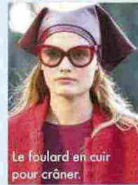
Le foulard en cuir pour crâner.