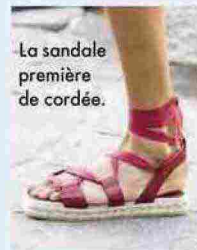
La sandale première de cordée.