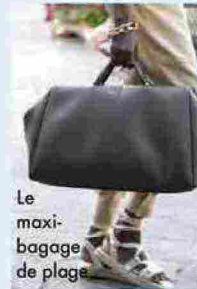
Le maxi-bagage de plage.